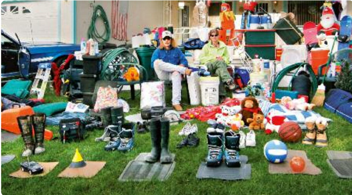
Wir sind im Haushalt umgeben von Produkten aus Kunststoff. Eindrucksvoll zeigt es dieses Bild aus dem Kinofilm „Plastic Planet“.